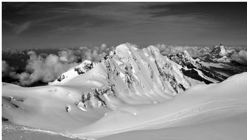
Lyscamm e Cervino (dal Colle del Lys, Monte Rosa)

Quaderno TAM n. 7 - Problemi energetici ed ambiente - del 2014