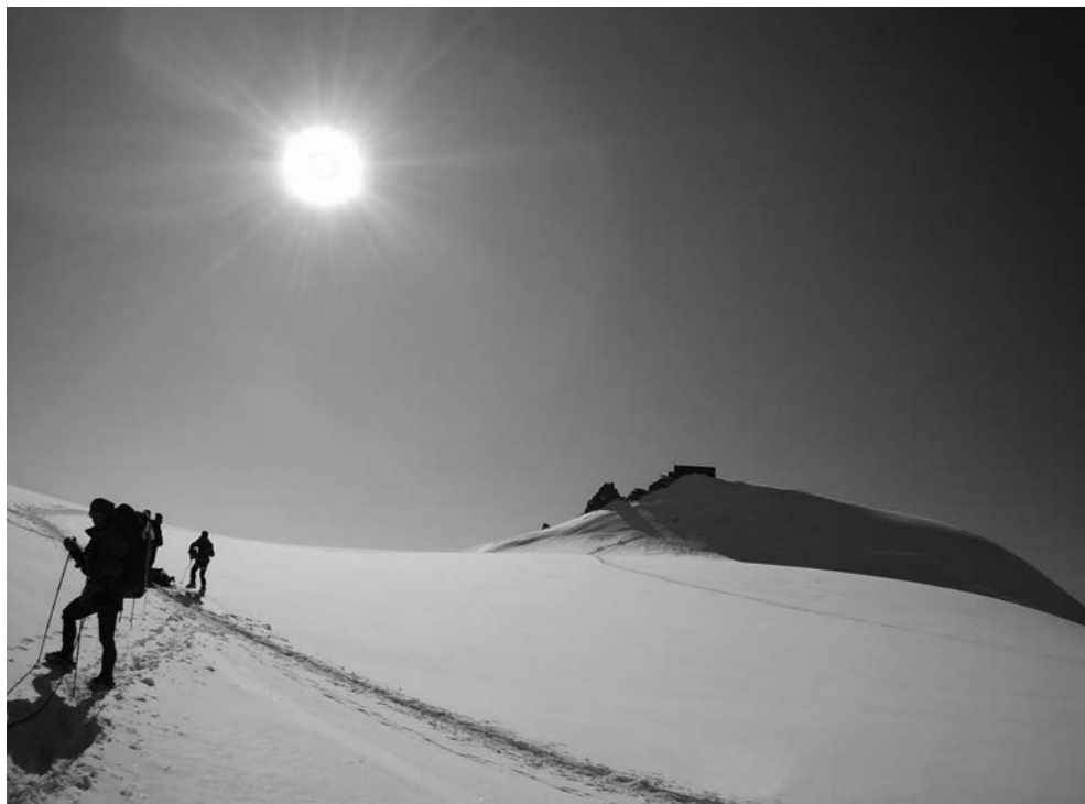
Monte Rosa - Punta Gniffetti, Capanna Regina Margherita (4554 m) - foto Giuseppe Celenza