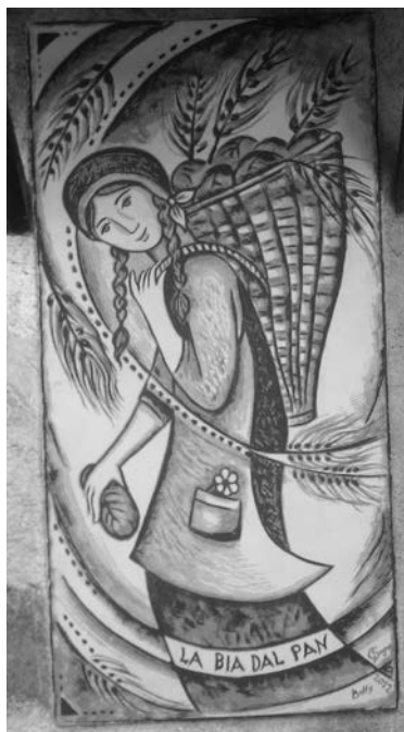
Cibiana di Cadore, murales