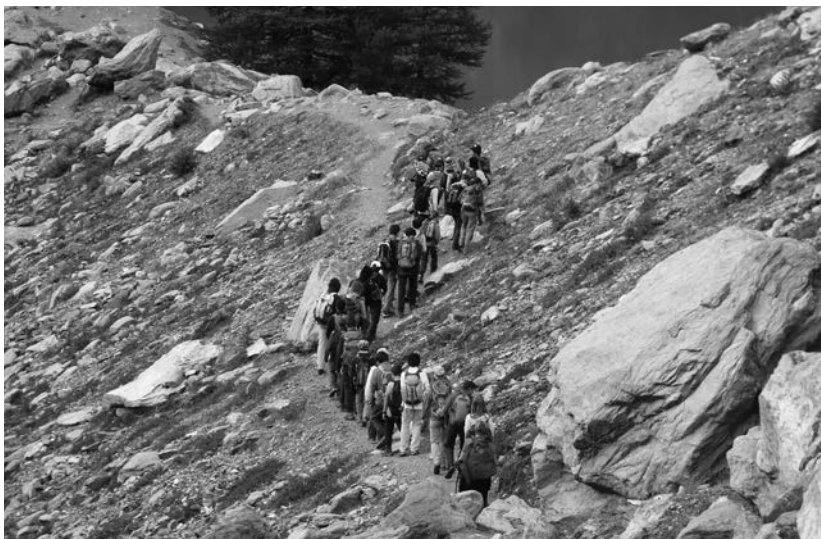
Valle d'Aosta - Val d'Ayas. Ragazzi dell'AG in escursione